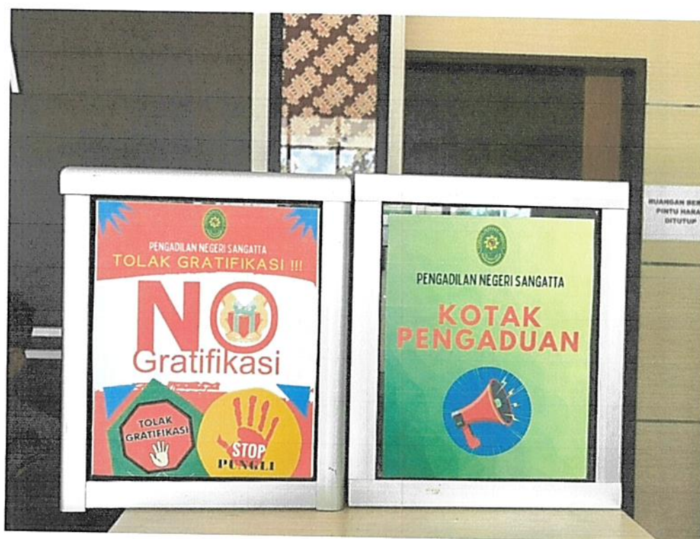
Gambar 6. Himbauan Anti Gratifikasi