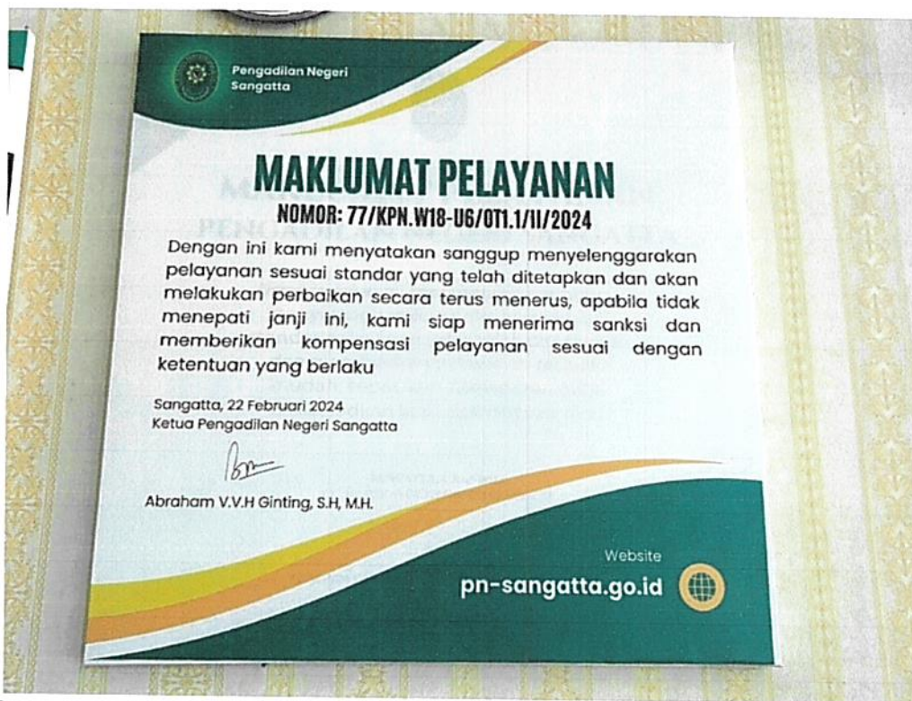
Gambar 4. Maklumat Pelayanan yang Sesuai dengan Standar Pelayanan yang Telah Ditetapkan