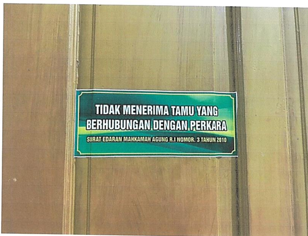
Gambar 5. Himbauan Menolak Tindakan KKN