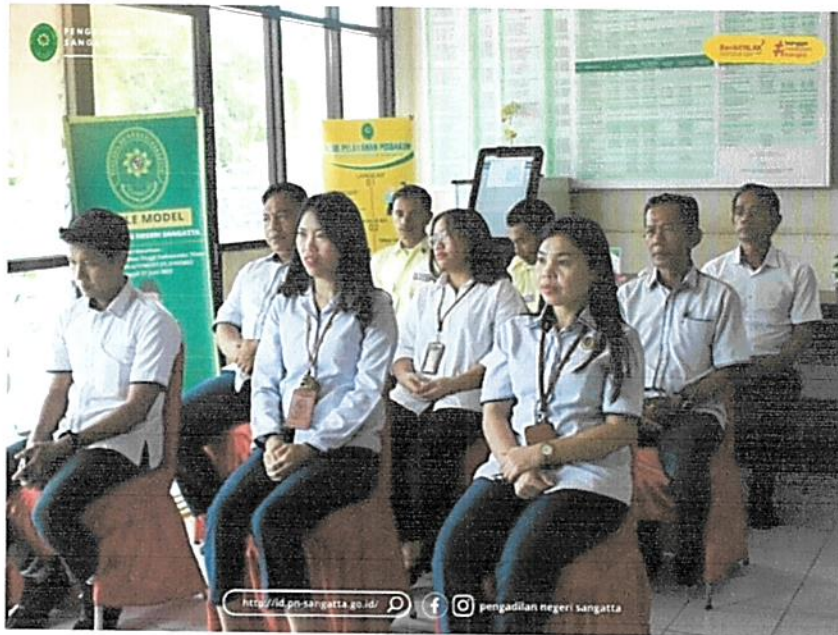
Gambar 3. Briefing Rutin Petugas PTSP