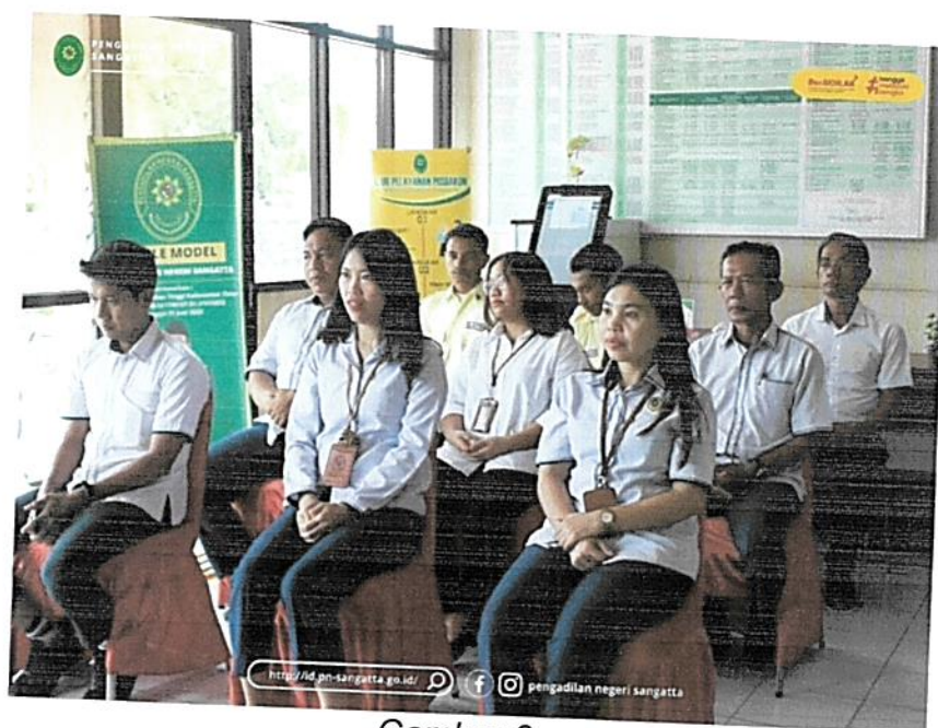
Gambar 3. Briefing Rutin Petugas PTSP