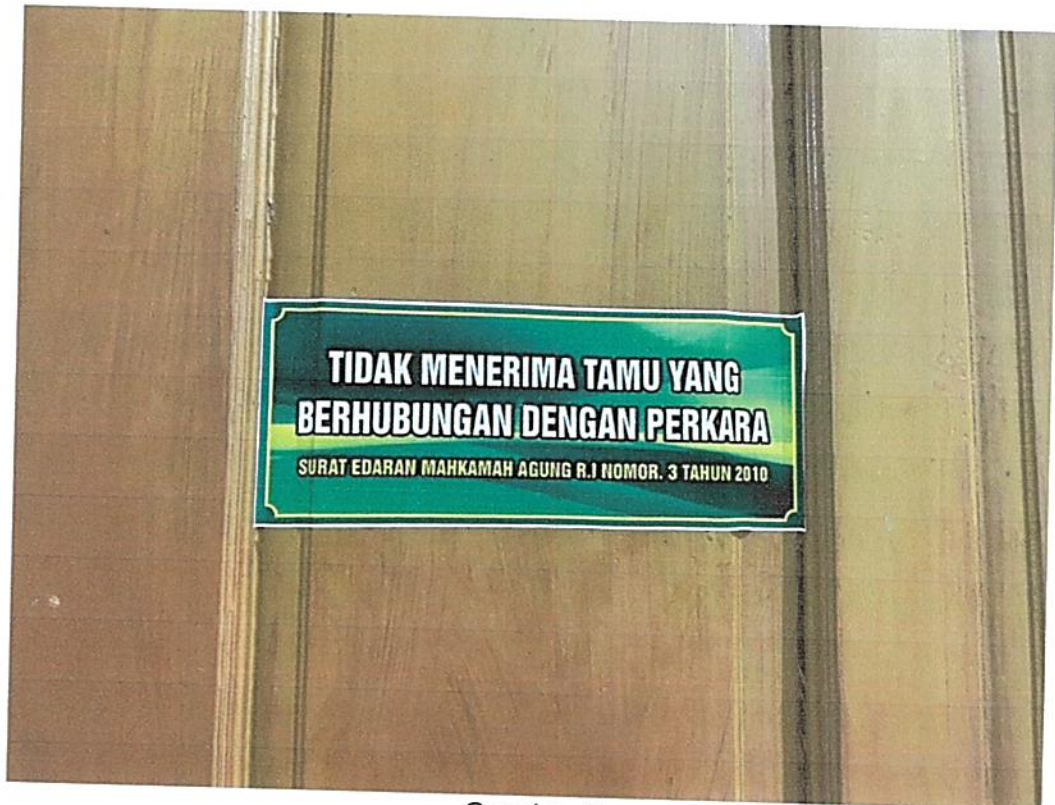
Gambar 5. Himbauan Menolak Tindakan KKN