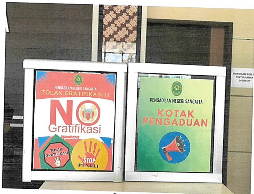
Gambar 6. Himbauan Anti Gratifikasi