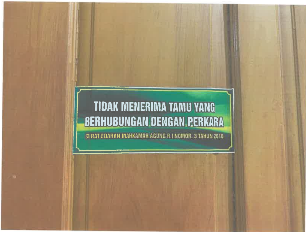
Gambar 5. Himbauan Menolak Tindakan KKN