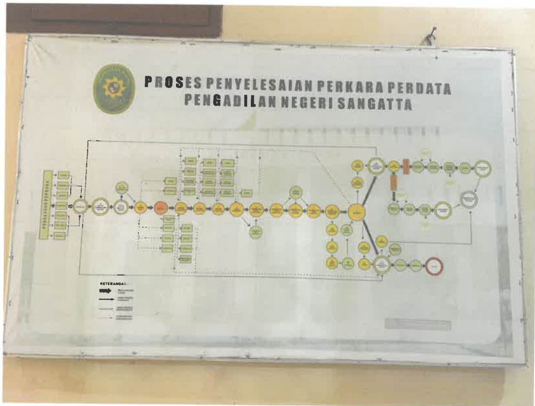
Gambar 1. Mekanisme Penyelesaian Perkara di Pengadilan Negeri Sangatta