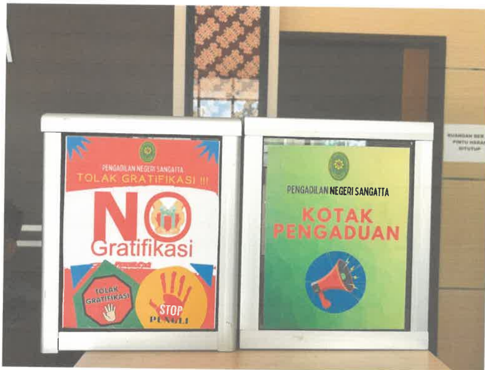
Gambar 6. Himbauan Anti Gratifikasi