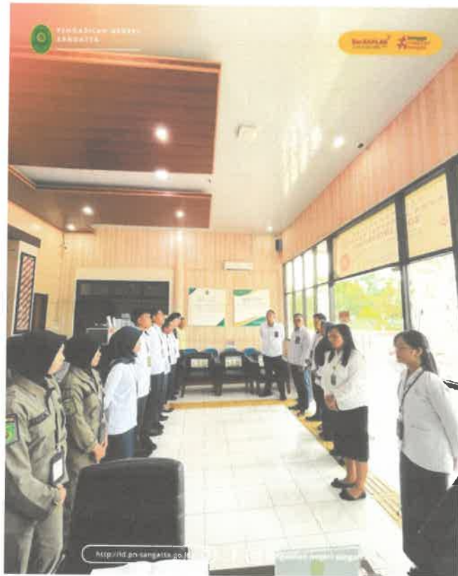
Gambar 3. Briefing Rutin Petugas PTSP